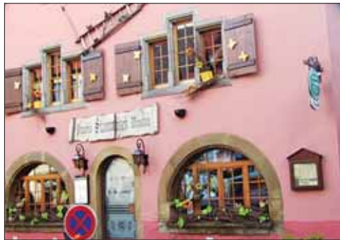
Colmars hus är pittoreska.