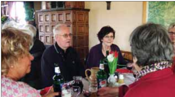
Trivsel vid en av restaurangerna som besöktes.

Succé för besöket i Schwarzwald, vinkultur i Alsace, EU-parlamentet, Europadomstolen