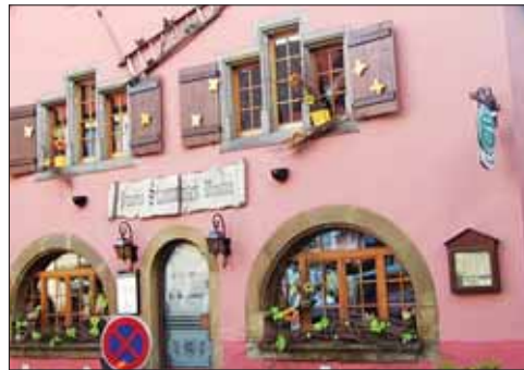
Colmars hus är pittoreska.