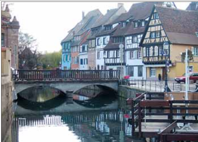
Det vackra Colmar med sina typiska broar, hus och floden som lugnt flyter genom staden.

De klagomål som inte hör till Europakonventionen avisas, men de måste dock ha förbehandlats . Förslag till beslut – kvali-