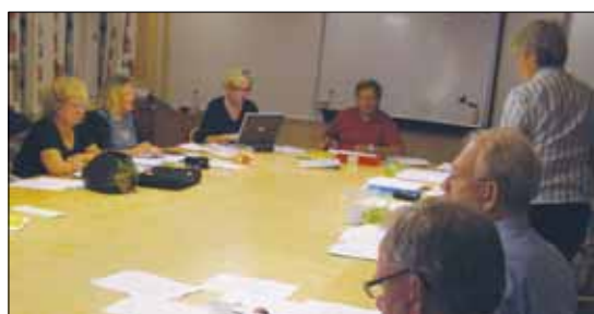
Förbundsstyrelsen runt konferensbordet.