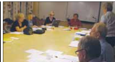
NRF:s nya förbundsstyrelse

Nya förbundsstyrelsen i sitt första helgmöte