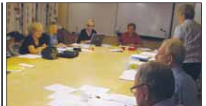
NRF:s nya förbundsstyrelse

Nya förbundsstyrelsen i sitt första helgmöte